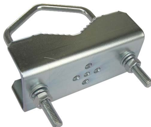
STR50 s úchytkou V85S

špeciálny držiak pre uchytenie produktov UBNT na trubku alebo stožiar