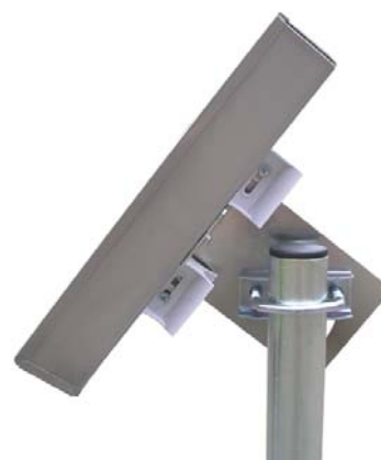
20RFM5 + DM60 (na trubke Ø 42mm)