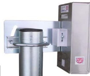
20RFM5 LOCO + DV85